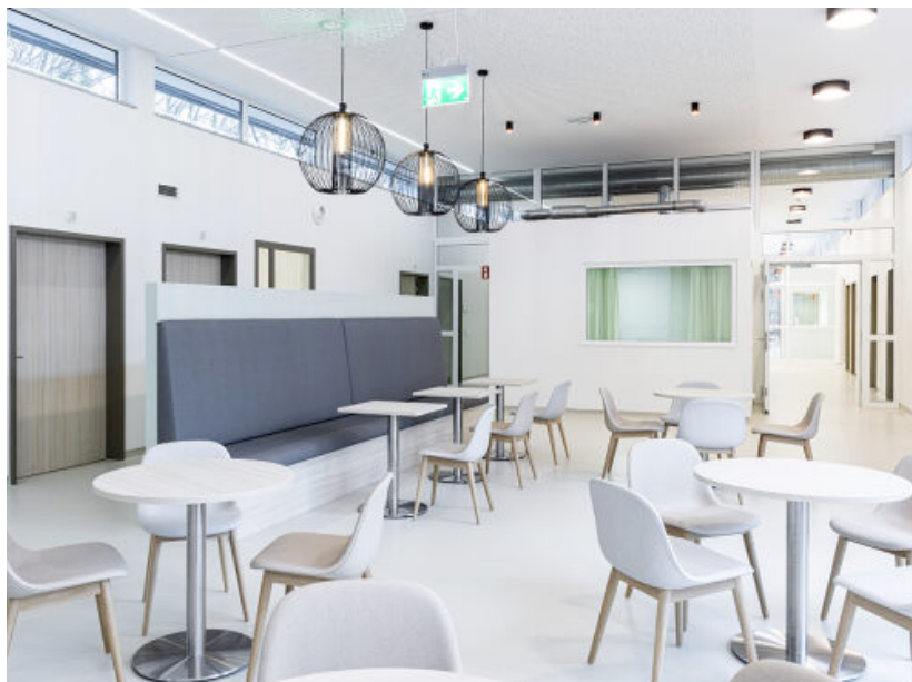
Abb. 1: Healing Environment in Gemeinschaftsräumen.

Je nach Tagesstimmung und Gemütszustand, erlaubt es Patientinnen und Patienten ungezwungen die Wahl zwischen verschiedenen Aufenthaltsorten im abwechslungsreichen Raumgefüge. Sei es im emotionalen Rückzugsmodus auf sicherem Terrain des privaten Patientenzimmers oder lieber extro-