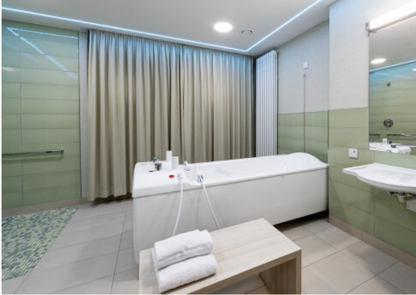
Abb. 2: Das Pflegebad mit Integration von Sound und Licht-Management.