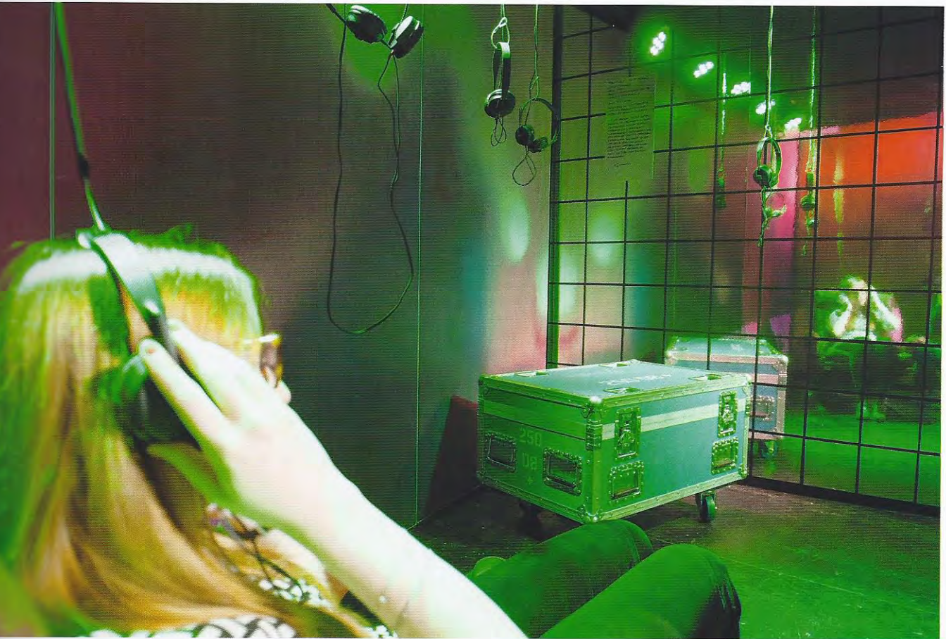
Size 275 m 2 | Exhibitor Kölnmesse GmbH, Cologne | Photos Volker Schäffner, COR, Dormagen; COR | Architecture / Design 100% interior. Sylvia Leydecker, Cologne | Lighting müllermusic Veranstaltungstechnik GmbH & Co. KG, Cologne | Media Akustikbüro Oldenburg / Hörzentrum Oldenburg GmbH, Oldenburg | Construction uniplan GmbH & Co. KG, Cologne