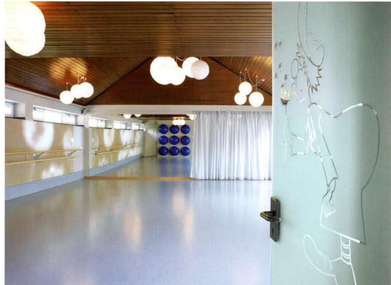
BLICK IN DEN TANZRAUM

Das renommierte Kölner Zentrum für Bewegung, Entspannung, Tanz und Theater sollte einen zweiten Standort erhalten. „Pusteblume“ wünschte sich dafür einprägsame und unverwechselbare Räume, die den Geist von Pusteblume widerspiegeln. Wesentlich ist die Vielfalt der Kurse von Yoga über Kindertanz bis hin zur Seniorengymnastik, die sich an Kinder über Großstadt-Singles bis zu Senioren richtet, also an ganz „normale“ Menschen. Das Farbkonzept wurde von Anfang an in den Entwurf integriert. Es zeigt sich für den Eintretenden in kräftig leuchtenden Farben. Klare Farbfelder in Blau, Grün, Pink und Weiß, die sowohl harmonisch als auch kontrastreich erscheinen, bewirken einzigartige Raumatmosphären und differenzieren die Räume voneinander. Pink changiert violett und entfaltet eine fast psychedelische Wirkung. Fugenloser blauer Epoxyboden durchdringt als