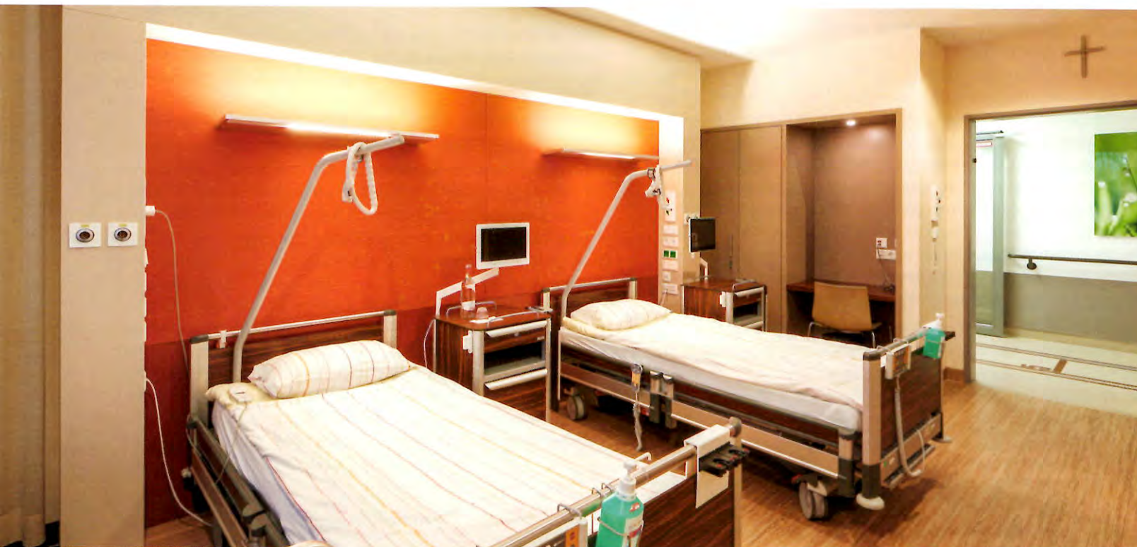
Die Zimmer kommen mit hochwertiger Zebranolholzoptik, edlen Taupetönen und cognacfarbenem Leder, geerdet mit roten Akzenten im Raum.

Kontakt: Sylvia Leydecker, Innenarchitektin bdiA AKG 100% interior, Köln Tel.: 0221/0570 800-0 info@100interior.de www.100interior.de